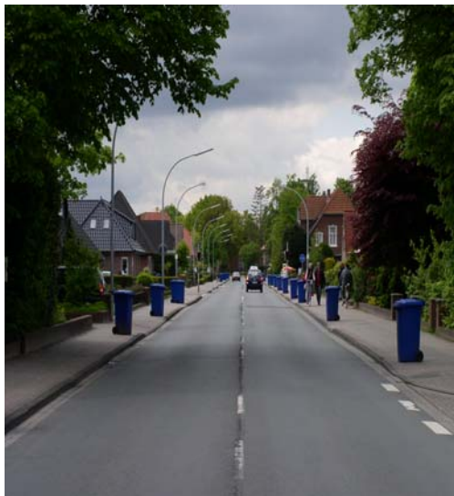
Zur Entleerung bereitgestellte Altpapiertonnen

Zu verzeichnen ist seitdem auch eine weitere Verbesserung des Erscheinungsbildes dieser Sammelstellen, deren Reinigung seit Ende 2004 von den Gemeinden bzw. der Stadt Westerstede wahrgenommen wird.