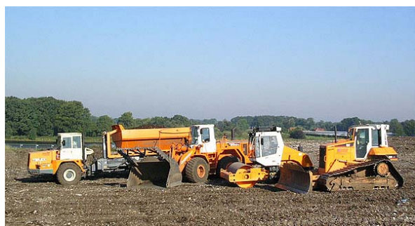
Transport- und Einbaugeräte auf der Deponie Mansie II

In der Gesamtbetrachtung ist der Abfallwirtschaft des Landkreises Ammerland die Umsetzung der neuen rechtlichen Rahmenbedingungen fristgerecht und umfassend gut gelungen.